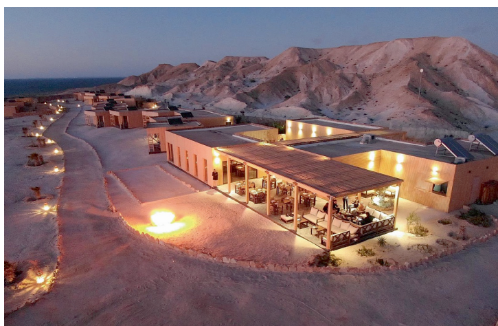
MAROC / KITESURF CAMP