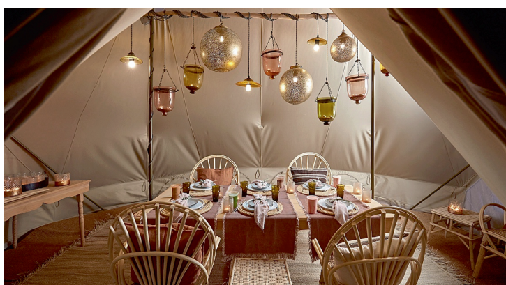
OMAN / CAMPEMENT DE LUXE